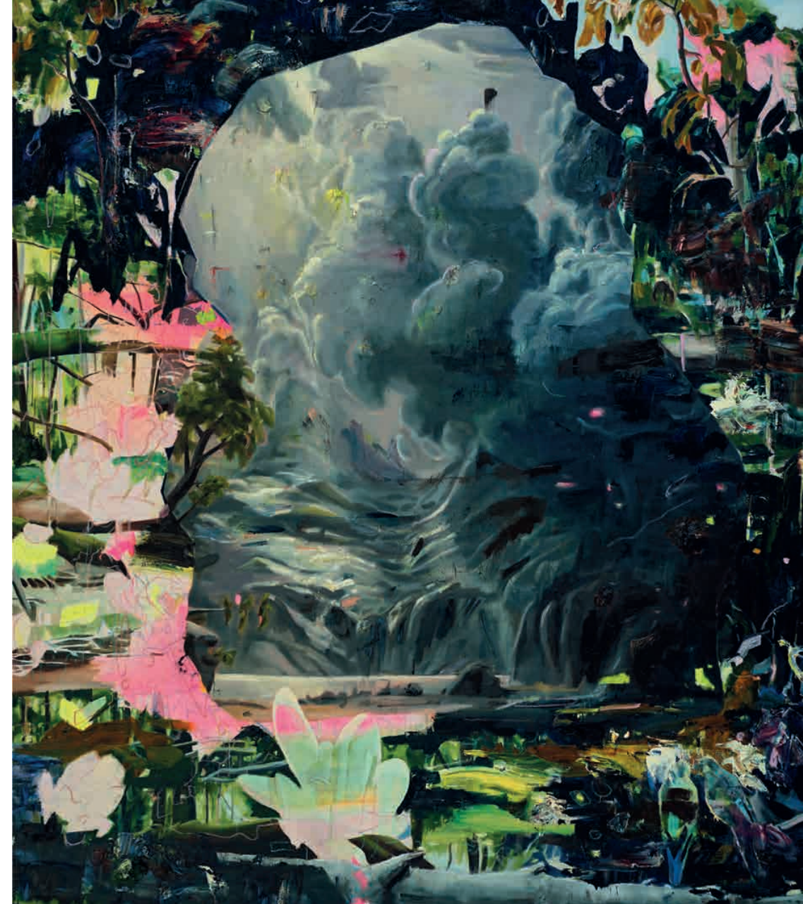
> ANNA BITTERSÖHL Morgen am Rand Öl auf Leinwand, oil on canvas / 230 x 200 cm / 2019