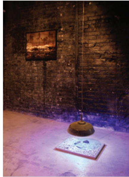
THE COMING OUT Installation / Sand aus der Bretagne, Industrielampe, Stahlseil und UV Licht / L'Amour, Bagnolet, Île de France 2015

Diese Fotografien stellt die Künstlerin mitunter in den inszenierten Dialog mit Installationen und Objekten. Kohle, Eneerisparlampen, Beton, Sand aus der Bretagne, Lichterketten, Emallie-Schüsseln und Foundobjekts verbindet Scorna zu Gesamtkompositionen, wie Buchen sollst du suchen oder The Coming out . Eine sich ständig erweiternde Serie von Zoofotografien Being Animal zeigt das Tier eingebettet in von Menschen geschaffenen typisierte Biotope – es entsteht eine