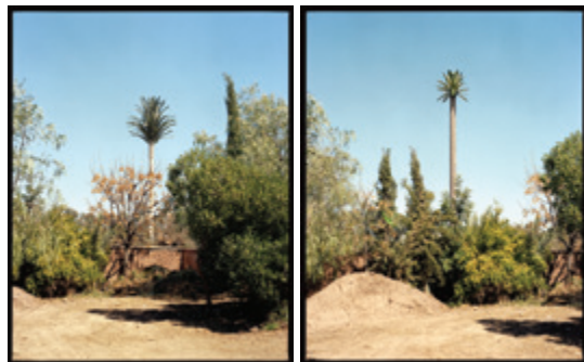
LES PALMIERS DU MAL, 1 Medium format print on alu dibond (double) 125 x 74 cm / 175 x 106 cm 3+2 AP / Ryad al Maaden Médina & Golf Resort Marrakesh, Marokko / 2017

Ihre Fotografien entstehen während ihrer vielen Reisen, auf welchen die analoge Mittelformat Kamera ihr ständiger Begleiter ist. Aufgrund der Wahl eines Filmmaterials mit hoher Lichtempfindlichkeit, der oft großformatigen Abzüge sowie dem Spiel mit der von der Tageszeit abhängigen, natürlichen Lichtsituation, entsteht eine oft malerische Ästhetik, welche durchaus Bezüge zur romantischen Malerei des 19. Jh. erkennen lässt. Die Bilder zeigen Bergansichten, welche vom Menschen gezeichnet sind, oder Landschaften, in denen fremdartig wirkende Zeugnisse menschlicher Existenz, wie Zementwerke oder Windräder eingebettet sind; in Marocco fotografierte Scorna Palmen, welche eigentlich Sendemasten sind, oder zeigt in einer anderen Serie unterirdische Grünanlagen in der Pariser Metro. In den letzten Jahren entstandene Fotografien haben dabei eines oft gemeinsam – die Abwesenheit des Menschen. Auf diese Weise entwickelt Scorna ein fast dystopisches Zukunftsszenario, in welchem der Mensch gegenüber der Natur nur noch einer Fußnote zu gleichen scheint.