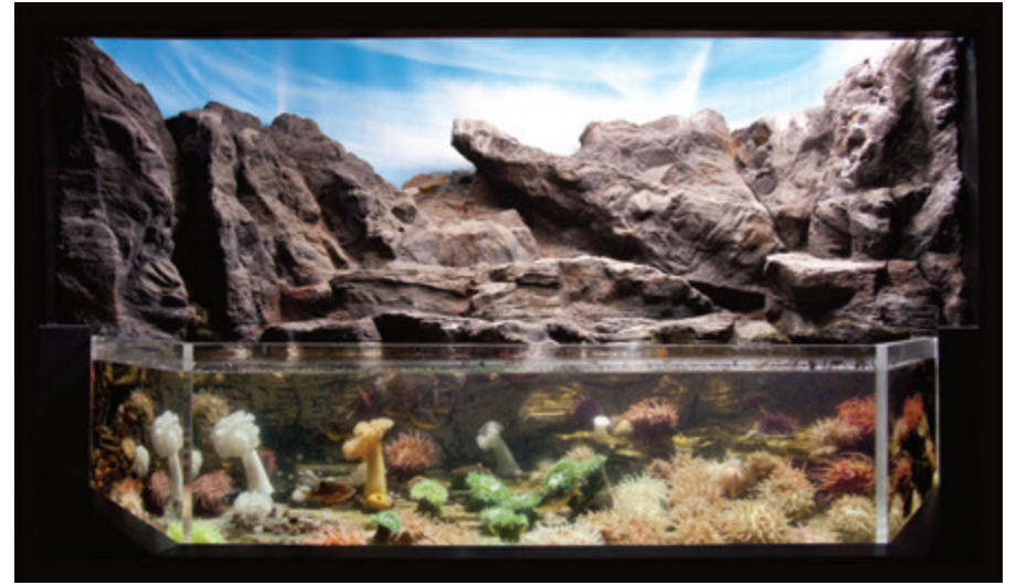
FAKE TREES Ausbelichtung auf Alu-Dibond / 154 x 91 cm / 108 x 63 cm / 3+2AP / Océanopolis, Brest, France / 2017