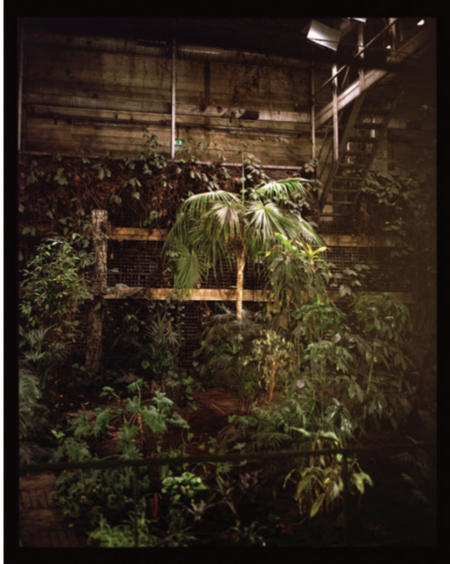
UNTERGRUND, 4 Medium format print on alu dibond / 60 x 74 cm / 84 x 106 cm 3+2 AP / Metrostation Gare de Lyon, Paris, France / 2017