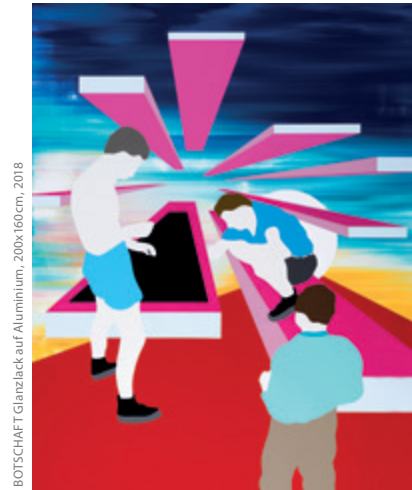
BOTSCHAFT Glanzlack auf Aluminium, 200x160cm, 2018

Stefan Schiek verwendet dabei industrielle Lackfarben auf einem Aluminiumträger. Die Werke wirken glatt, sauber, geradezu maschinell erstellt, jedoch ist der Malprozess mit einer großen körperlichen Anstrengung verbunden. Unzählige Lackschichten entwickeln durch häufiges auftragen und abschleifen nicht nur eine für Lackfarbe unübliche Tiefe und Transparenz sondern durch Untermalungen auch eine reliefähnliche, hochglänzende Oberfläche. In der aktuellen Ausstellung geht Schiek einen großen Entwicklungsschritt weiter und zeigt neben Malerei auch Zeichnungen, Wandobjekte und Bronzefiguren.