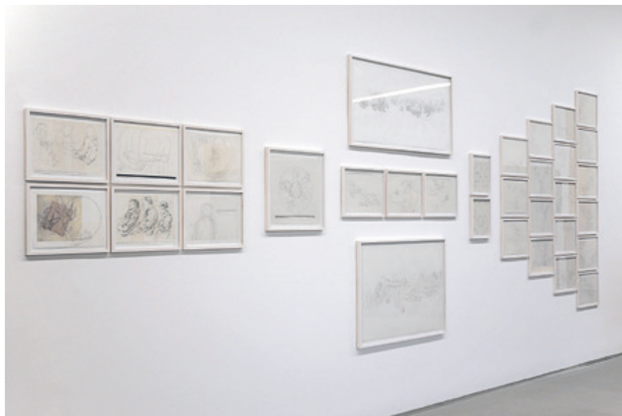
^ RHYTHMUSANALYSE / RHYTHMANALYSIS projection on drawing on acrylglas, mini beamer, tripod, fortlaufendes Projekt Projektion auf Zeichnung auf Acrylglas, Mini-Beamer, Stativ, , 2020