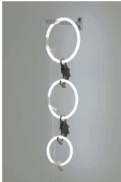
FREDERIK FOERT Moonfishing Installation, ca. 120 x 30 x 30 cm, 2012

ben in denen Sie sich mit der gegenwärtigen Notwendigkeit der Neufindung einzelner Geschlechterrollen auseinandersetzt. Tianhong Sheng studierte Malerei an der CAFA in Beijing und an der Kunstakademie Düsseldorf. Er zeigt ein aus 160 Einzelbildern bestehendes Tabloid, welches kleinformatige, rote Tuschezeichnungen von Stadtansichten, humorvollen Alltagsszenen, Idolen aus Film- und Kunstgeschichte, Textfragmenten aus dem ideologisch geprägten Chinesischen Alltag zeigt und uns somit einen Einblick in einen fernen Kulturkreis offenbart. Caucasso Lee Jun beschäftigt sich in seiner aktuellen Serie mit verschiedenen historischen Ereignissen in China. So auch die hier gezeigte Fotografie mit dem Titel 1949 - dem Jahr der Gründung der Volksrepublik Chinas. Ein umfangreiches