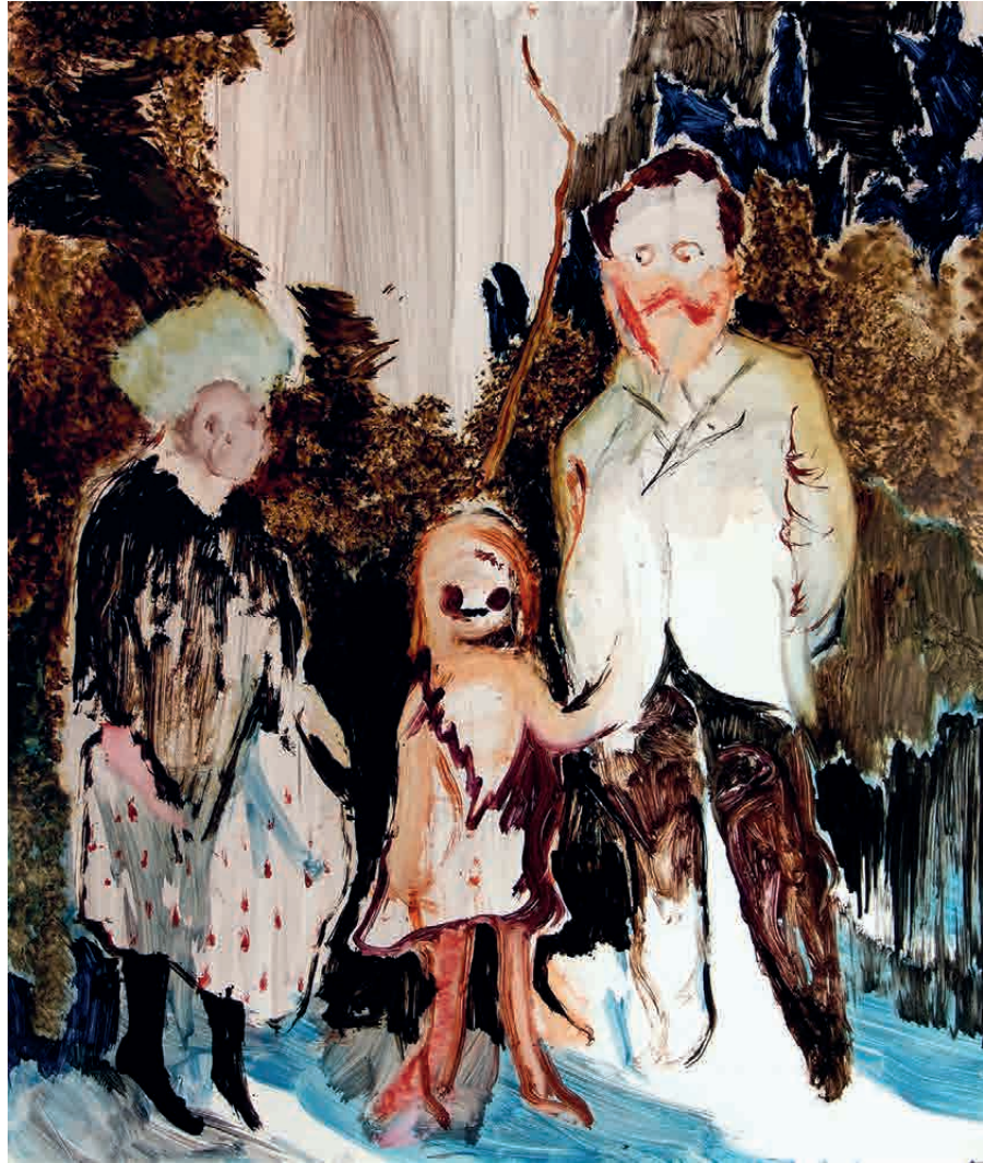
RAO FU 傅饶 Familie Kessler Bitumen und Öl auf Papier 颜料和沥青在纸上 50 x 44 cm / 2018