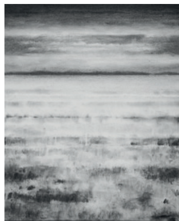
Enrico Freitag, o.T. Kohle auf Leinwand, 54 x 45 cm, 2023

Seine figurative Malerei und Zeichnung kokettiert mit der Abstraktion und fordert uns in unseren Sehgewohnheiten heraus - ein lebendiges Nebeneinander von intensivem Duktus, fein gesetzten Schattierungen, starken Hell-Dunkel-Kontrasten und abstrakt wirkenden geometrischen Einschüben. Seine eigentlich sehr farbgewaltigen Kompositionen werden in dieser Ausstellung ersetzt durch Arbeiten mit Kohle auf Leinwand. Dadurch schafft er es, seine bekannten kleinformatigen Zeichnungen und Aquarelle in eine neue Dimension zu übertragen. Alles scheint