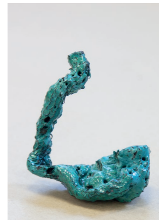
o.T. (The ScorSpion (emaillierte Stahlwolle) / 9 x 10 x 6 cm, 2015 o.T. (The ScorSpion (enamelled steel wool) / 9 x 10 x 6 cm, 2015

2019 24th Federal Prize for Art Students, Bundes-Kunsthalle, Bonn / 2018 Bauhaus Essentials 9 / 2017 GRAFE Creative Prize of Bauhaus - University of Weimar / 2014 - 2019 Initiation of NEWSYMP (Symposium on Enamel) in Erfurt / 2007 - 2019 Study Visual Communication, Bauhaus - Universität Weimar / 2002 - 2004 Training as technical draftsman / 1983 born in Erfurt as Christoph Lenz