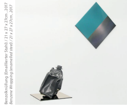
Benzolknüttung (Emaillierter Stahl) / 21 x 27 x 27cm, 2017 Benzene Wrapping (enamelled steel) / 21 x 27 x 27cm, 2017

Slag is a by-product of steelmaking, naturally similar in texture to volcanic rock. The slag hook, in turn, is the tool with which the metal smelter pulls this by-product out of the blast furnace. In this sense, the title of the exhibition can be understood as a connecting element between nature and man or industry and craft - because this is precisely where Christoph Blankenburg's work is to be situated. Christoph Blankenburg fires enamel panels into colour-intensive abstract landscape paintings or enamel objects whose forms are borrowed from nature or everyday industrial life, he explores the rural idyll and reclaims it as a stage in his video works, he draws uninhibitedly and powerfully, courageously without any hint of mannerism, he performs physically revealing often in direct dialogue with people or local occurrences, his photographs are experiments with physical laws of light or attentive observations of nature. Blankenburg sees himself as a scientist who takes his legitimation for research from the freedom of art. In this way, the artist makes us believe that he can disregard gravity and suspend other laws of nature. In his search for tipping moments, he breaks habits, develops cryptic plot lines with the aim of questioning our own perception. As a kind of transmitter, he has the ability to transport something from the offstage to the surface and to create situations that slide into the absurd.