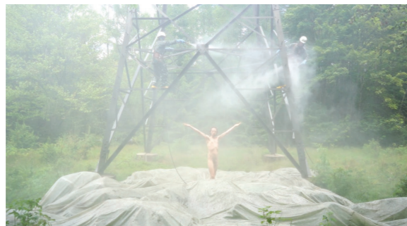
Hochtrassenperformance / Videostandbild, 2020 elevated track performance / video still, 2020

In der Ausstellung bei EIGENHEIM Berlin (Salon) wird die künstlerische Arbeit von Christoph Blankenburg einem Schaudapot ähnlich erlebbar gemacht. Der Geruch von Harz, die großen Emaillearbeiten, die Fotografien und Zeichnungen werden, auf Lagerregalen genauso gezeigt, wie die Video- und Objektarbeiten.