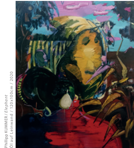
Phillipp KUMMER / Elefant Öl auf Leinwand / 120x100cm / 2020

ist der Tisch. Die Zeichnungen sind Feinstarbeit, zeugen von stundenlanger Konzentration. Rückstände der vielfach angespitzten Bleistifte in einer Schachtel. Bei einem Kaffee unterhält man sich über Organisatorisches und weitergeht's zu,-